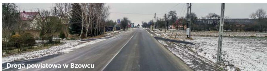
Droga powiatowa w Bzowcu

W 2021 roku zrealizowaliśmy 4 inwestycje na drogach gminnych oraz jedno zadanie we współpracy z powiatem krasnostawskim na drodze powiatowej w Bzowcu. Oznacza to, że w ciągu jednego roku inwestycje objęły 6 odcinków dróg co dało niespełna 6,5 km zmodernizowanych dróg (w tym 5,5 km z nową nawierzchnią asfaltową).