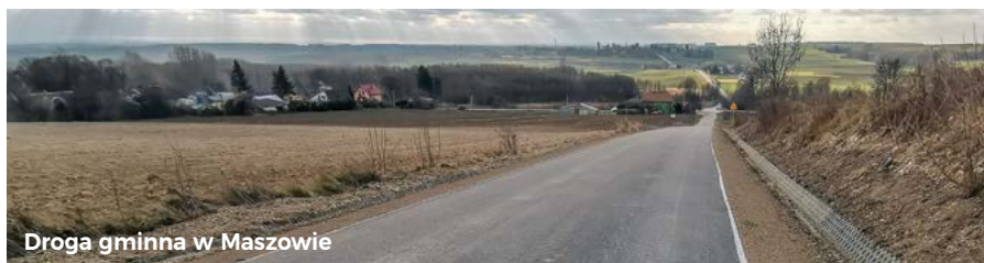
Droga gminna w Maszowie