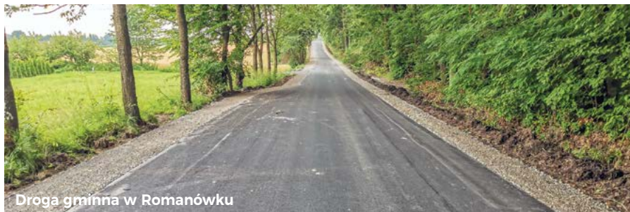
Droga gminna w Romanówku

tacja z Rządowego Funduszu Rozwoju Dróg. Udział finansowy Gminy Rudnik w kosztach zadania wyniósł 933 065,00 zł, dzięki czemu przebudowana została droga powiatowa w Bzowcu (od Władysławina do Gruszki Małej) na dwóch odcinkach o łącznej długości 3,5 km. Przeprowadzone w ramach inwestycji prace obejmowały: wykonanie nowej nawierzchni, poszerzenie jezdni do szerokości 6 m, wzmocnienie podbudowy, wykonanie rowów przydrożnych, wykonanie przepustów, utwardzenie zjazdów oraz wykonanie oznakowania.