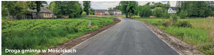
Droga gminna w Mościskach